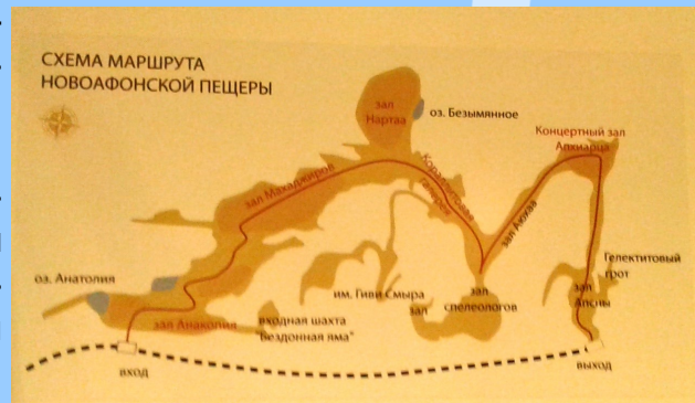
Схема Новоафонской пещеры

крыта практически случайно уроженцем этих мест Гиви Смыром в 1961 г. Четверо местных спелеологов тут же исследовали обнаруженную систему пещер, поразившись её размерам и величю. Неудивительно — объем более 1 млн м 3 (с недавно обследованными тоннелями — более 3 млн м 3 ), общая протяженность только исследованных подземелий — более 12 км. В 1975 г. уникальный подземный комплекс оборудовали тремя искусственными входами, специальными мостками и небольшой подземной железной дорогой.